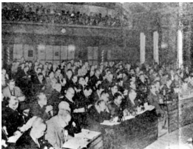
第24回定例代議員会会場風景