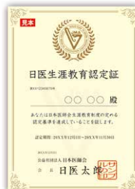
日医生涯教育認定証