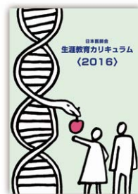
生涯教育カリキュラム(2016)