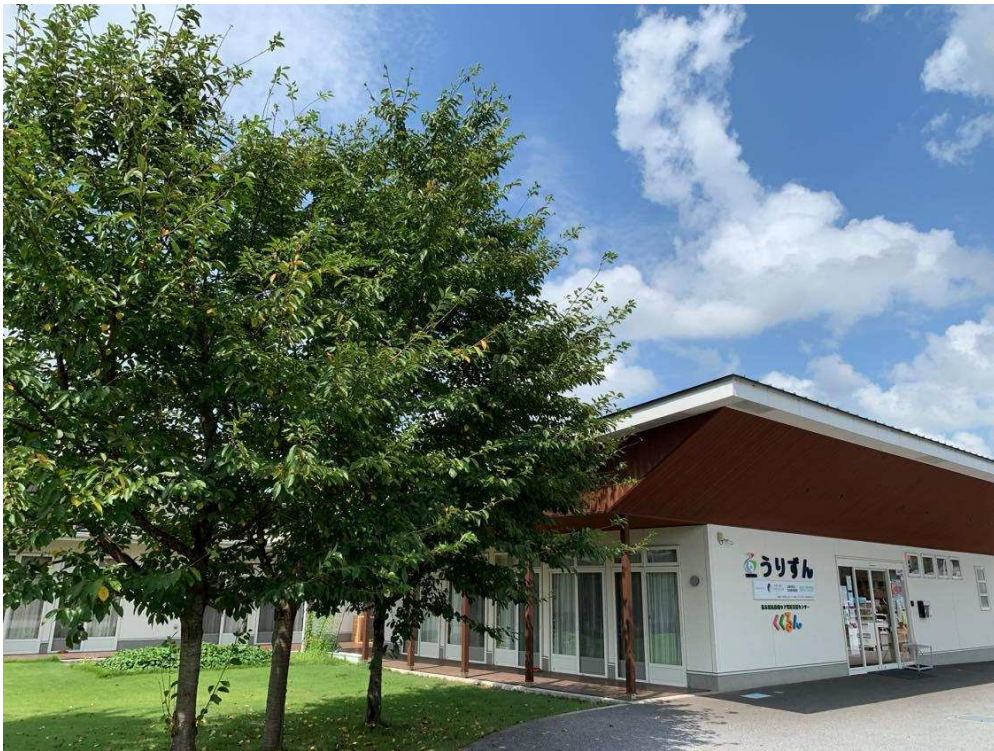
うりずんの玄関と庭