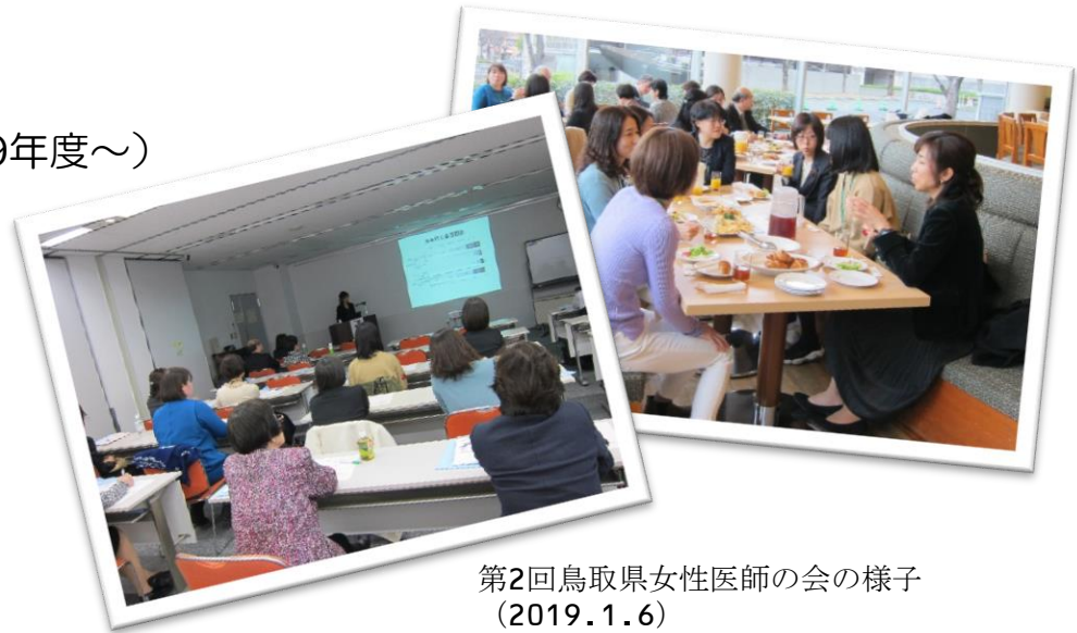
第2回鳥取県女性医師の会の様子 (2019.1.6)