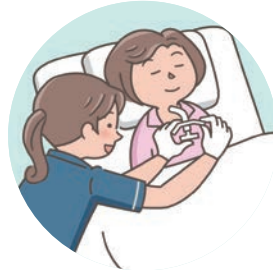
気管カニューレの交換