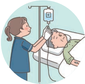
脱水症状に対する輸液による補正