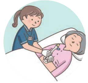
胃ろうもしくは腸ろうカテーテル又は胃ろうボタンの交換