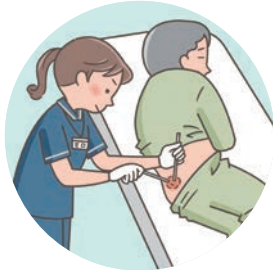
褥瘡または慢性創傷の治療における血流のない壊死組織の除去