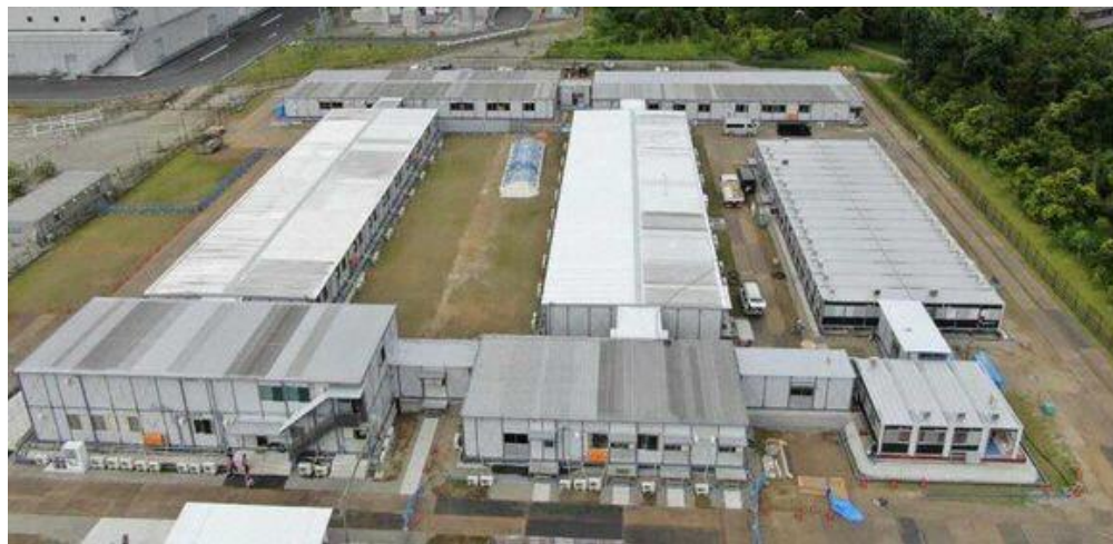
(上) 湘南鎌倉総合病院隣接施設の全景。 (右上) 施設内に設置されたCT (右下) 施設内のナースセンター