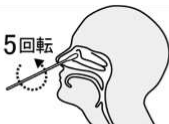
鼻腔ぬぐい液採取