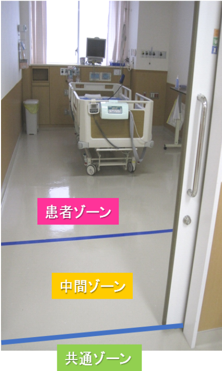
病室ゾーニングの1例