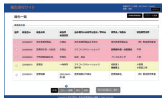
◀報告書登録済みの場合